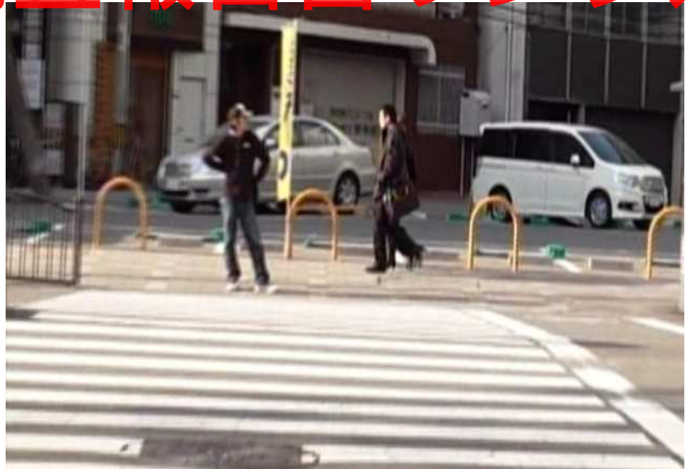
大阪市北区中津1丁目13番地付近