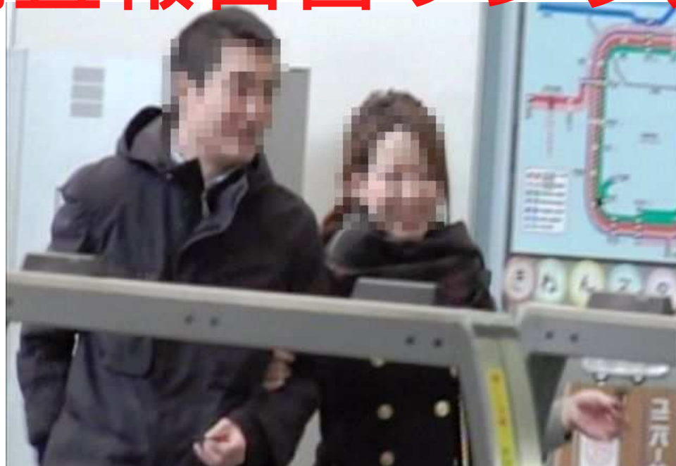
「JR ユニバーサルシティ駅」

午後 3時30分 両名が、大阪市此花区桜島2丁目1-33に所在のテーマパーク「ユニバーサル・スタジオ・ジャパン」付近の入場券売